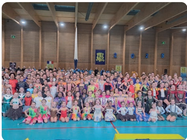
Les championnats de France duo ont attiré 450 spectateurs à Janville.