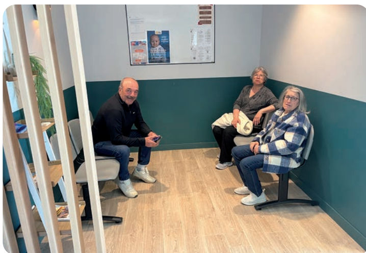
Les patients plébiscitent le confort des lieux, et notamment des salles d'attente.