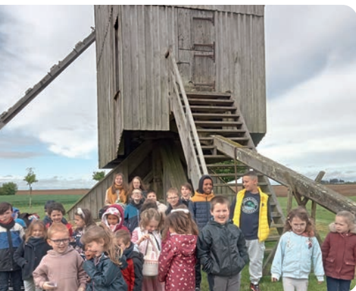
La traditionnelle chasse aux œufs de Pâques a attiré une quarantaine d'enfants cette année.