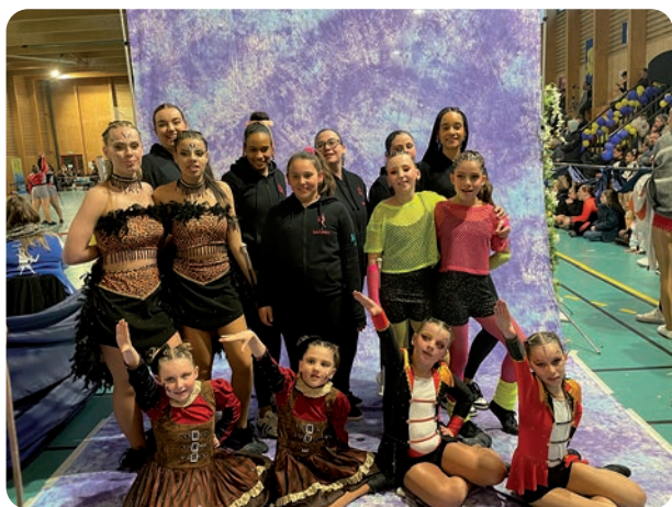
Le club de Ouarville est fier d'avoir pu faire rayonner la commune à travers ces championnats.

Traditionnellement, les majorettes sont expertes dans le maniement du bâton. En mars dernier, à Janville-en-Beauce, c'est quasiment un bâton de maréchal qu'elles ont manié, en organisant les championnats de France duo. Une belle récompense, voire une première consécration, pour ce club « Les Féeries » créé il y a seulement six ans, mais qui depuis deux ans a pris une nouvelle dimension en se rapprochant de l'AFMF (Amicale des fanfares et majorettes de France). C'est pour le club l'opportunité de se produire dans différents rendez-vous comme le 1er mai qui réunit traditionnellement un petit millier de majorettes (Saint-André-de-l'Eure cette année).