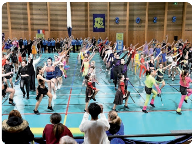
20 troupes venues de toute la France ont participé à cette compétition