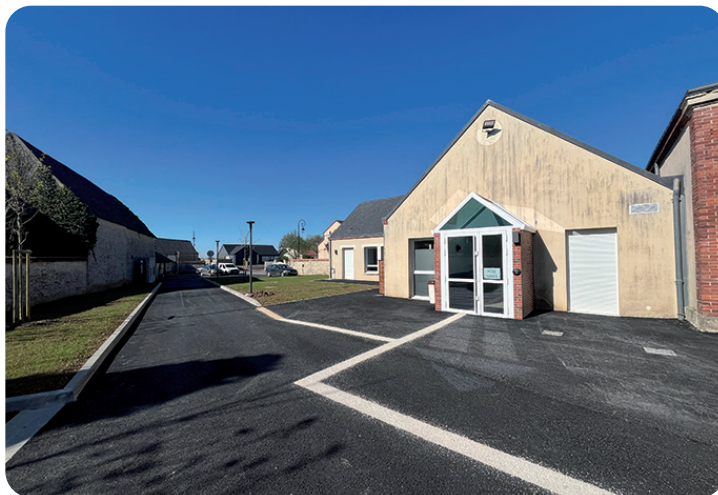
Le Pôle santé a pris corps sur le site de l'ancienne école, à l'arrière de la mairie.

« Nous avons gardé une salle de classe, celle qui jouxtait la mairie en la transformant en salle du conseil. Si besoin, nous pourrions provisoirement l'aménager », note le maire. Les abords du Pôle santé ont aussi fait l'objet de toutes les attentions. Le transfert de l'ancien hangar municipal, et la transformation de l'espace ont permis l'aménagement de places de parking, avec un accès qui se fait par la rue des Tilleuls. En peu d'années, c'est tout le secteur de la mairie qui a été redessiné à travers la médiathèque, le groupe scolaire et désormais le Pôle santé.