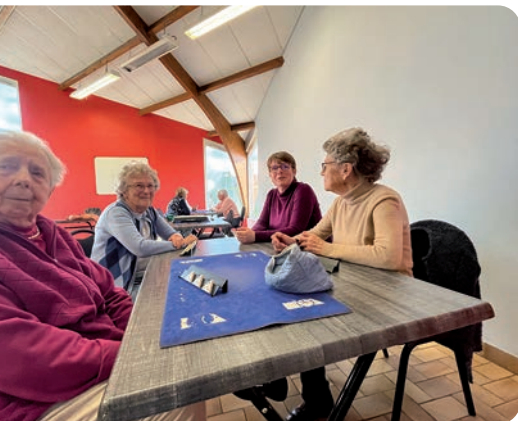
Un mercredi sur deux, les membres du club de l'Amitié se retrouvent à la salle des Quatre Vents pour jouer et échanger